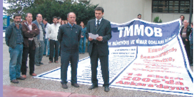
13 Ekim 2006, Kocaeli