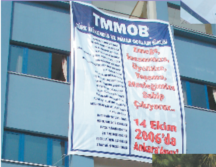
12 Ekim 2006, Bursa