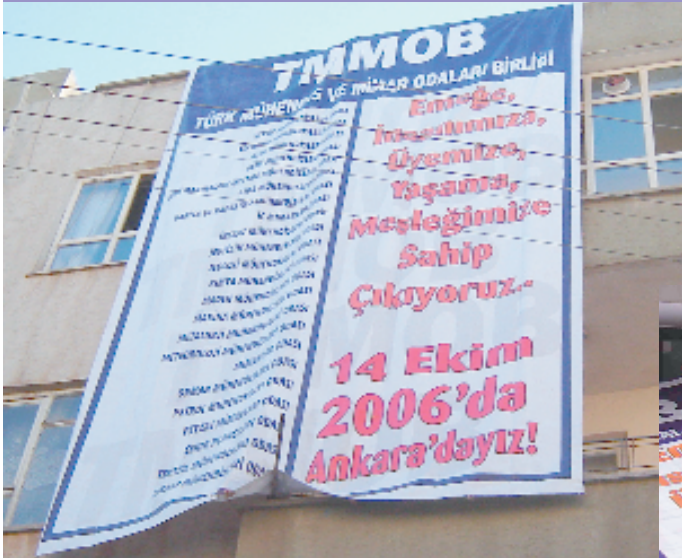
8 Ekim 2006, Şanlıurfa