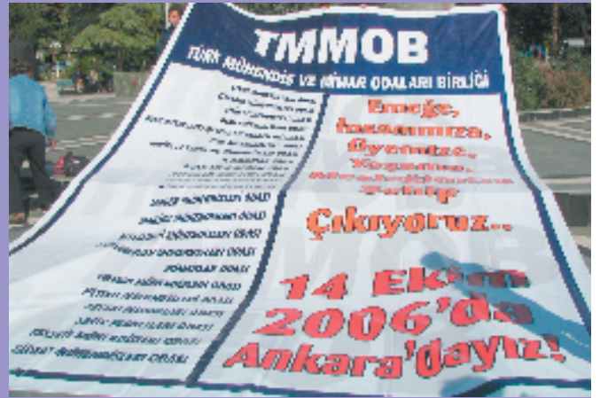
11 Ekim 2006, Kırklareli