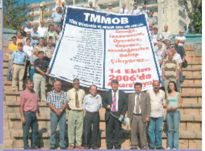
6 Ekim 2006, Antalya