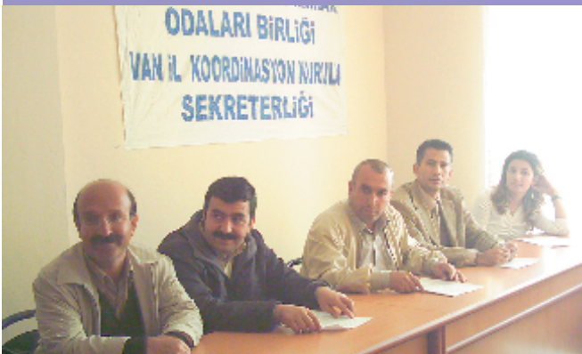
10 Ekim 2006, Van