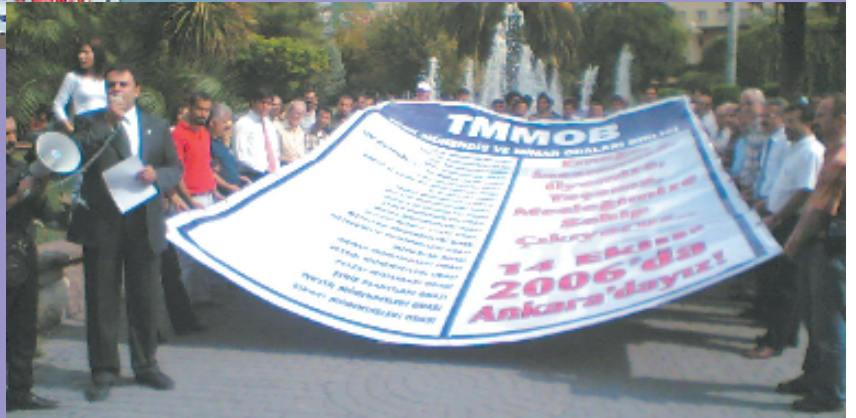
12 Ekim 2006, Adana