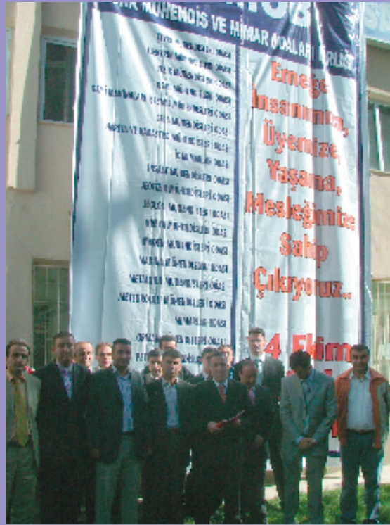
9 Ekim 2006, Hakkari