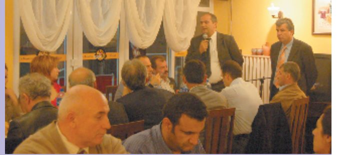
Ankara, 4 Ekim