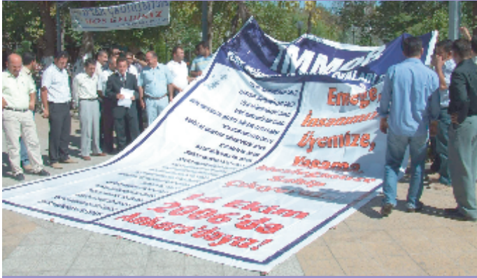
6 Ekim 2006- Adıyaman

Ayrıca, TMMOB tarafından hazırlanan 7 adet miting pankartı illerde dolaştırılarak, her ilde İKK bileşenlerinin de katılımıyla basın açıklamaları gerçekleştirildi. Miting pankartları 8 günde 31 ili dolaştı.