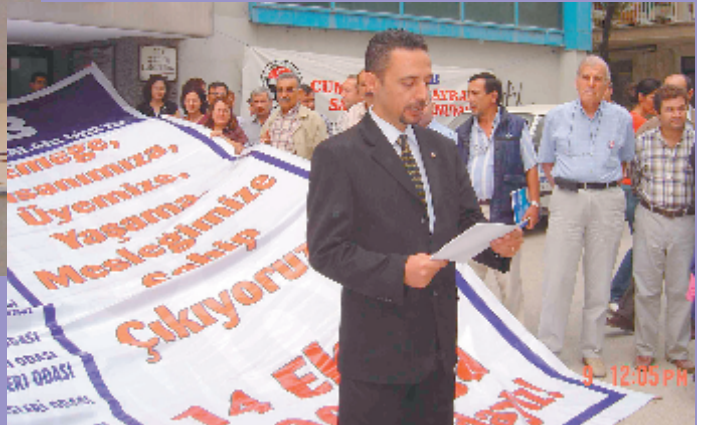
9 Ekim 2006, Denizli