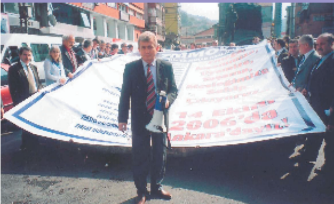
12 Ekim 2006, Zonguldak