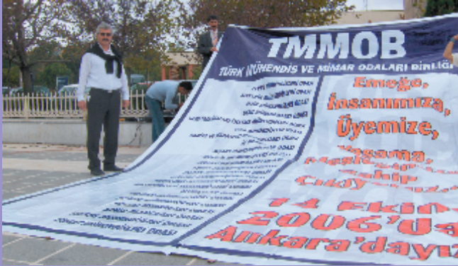
9 Ekim 2006, Çanakkale