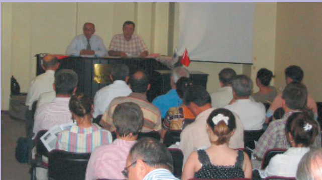
Adana, 10 Ekim