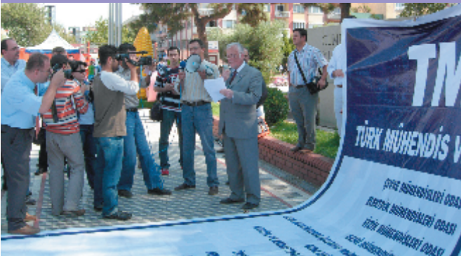
10 Ekim 2006, Aydın