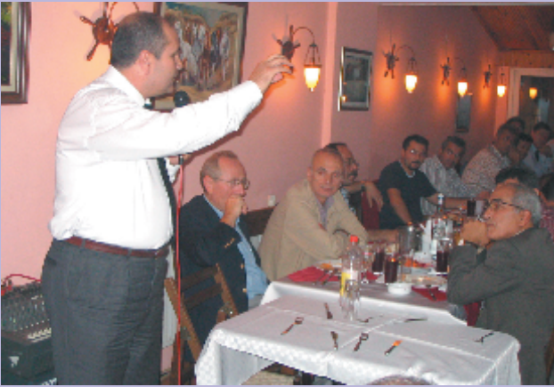
İstanbul, 30 Eylül