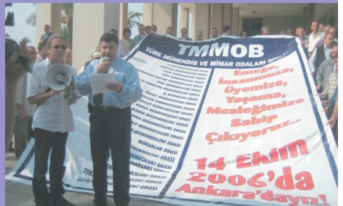
11 Ekim 2006, İzmir