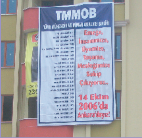
10 Ekim 2006, Edirne