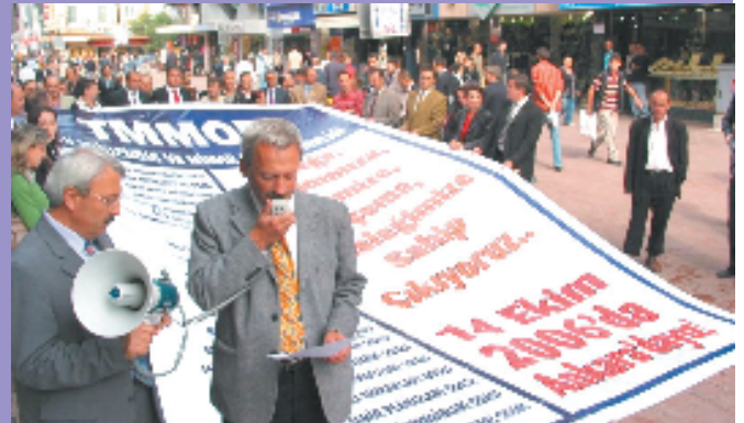
13 Ekim 2006, Samsun