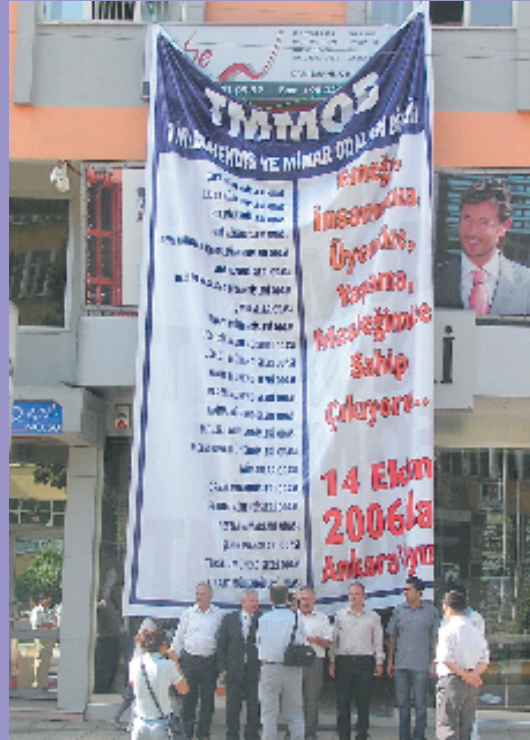
10 Ekim 2006, Kahramanmaraş