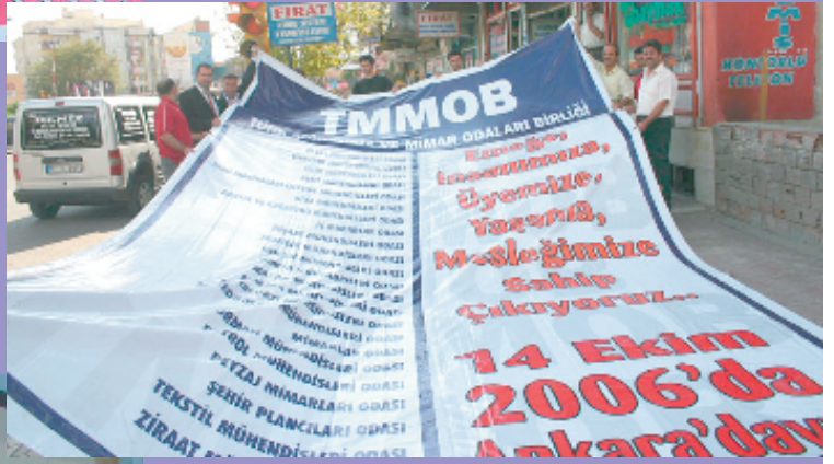
11 Ekim 2006, Batman