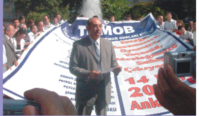
9 Ekim 2006, Gaziantep