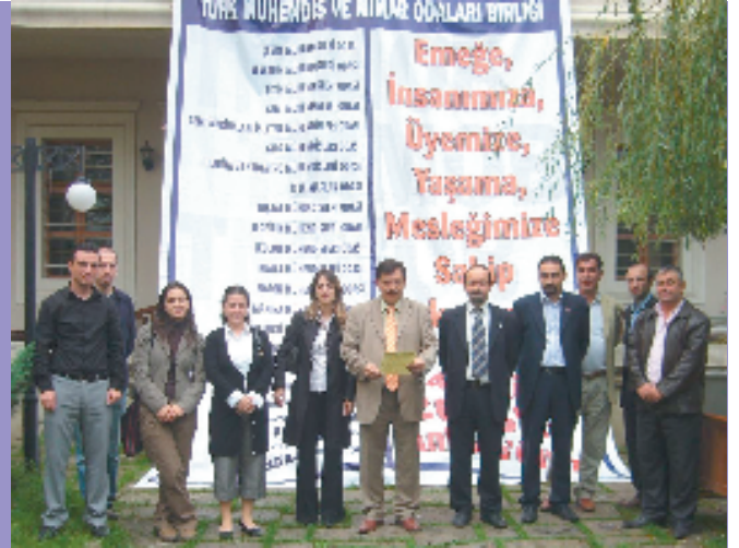
12 Ekim 2006, Trabzon