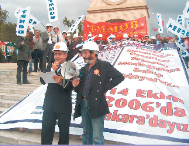
12 Ekim 2006, İstanbul