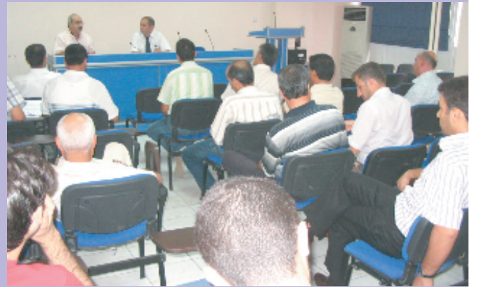
Diyarbakır, 25 Eylül