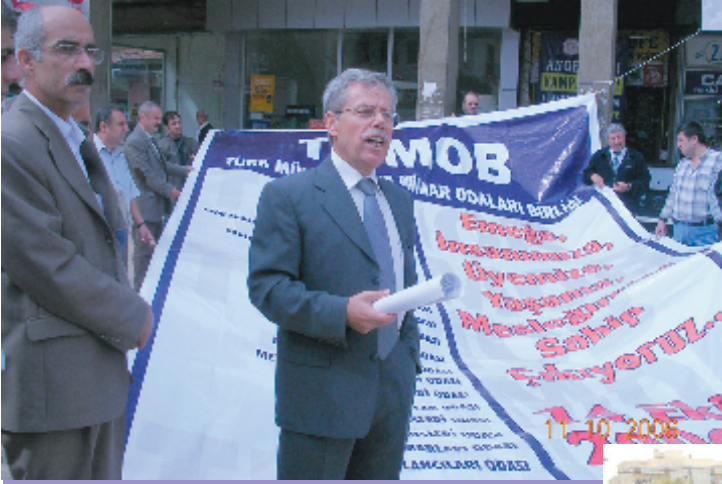
11 Ekim 2006, Balıkesir