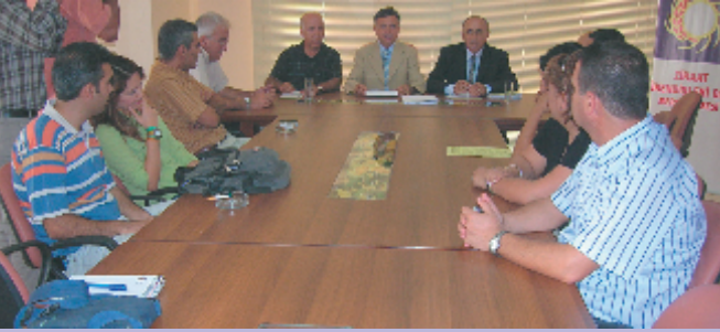
Mersin, 10 Ekim

Ayrıca, mitingine yönelik çalışmalarını değerlendirmek üzere TMMOB Yönetim Kurulu, İstanbul İKK temsilcileri ile 30 Eylül günü bir araya geldi.