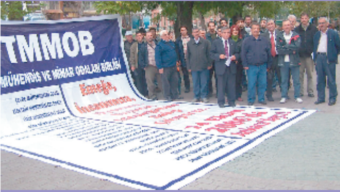
13 Ekim 2006, Eskişehir