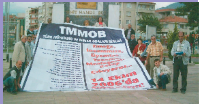
10 Ekim 2006, Edremit