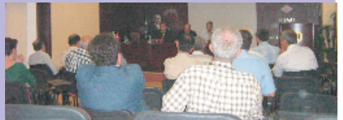
Antalya, 5 Ekim